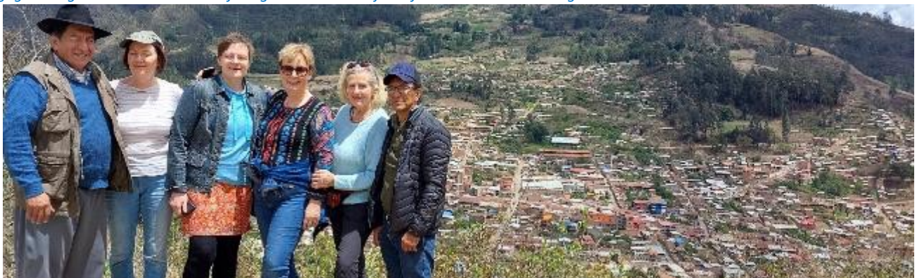
Freunde ohne Grenzen leisten ehrenamtliche Arbeit, egal wo wir sind, aber wichtig sind die ERGEBNISSE für diejenigen, die es in unserer Gesellschaft am meisten brauchen.