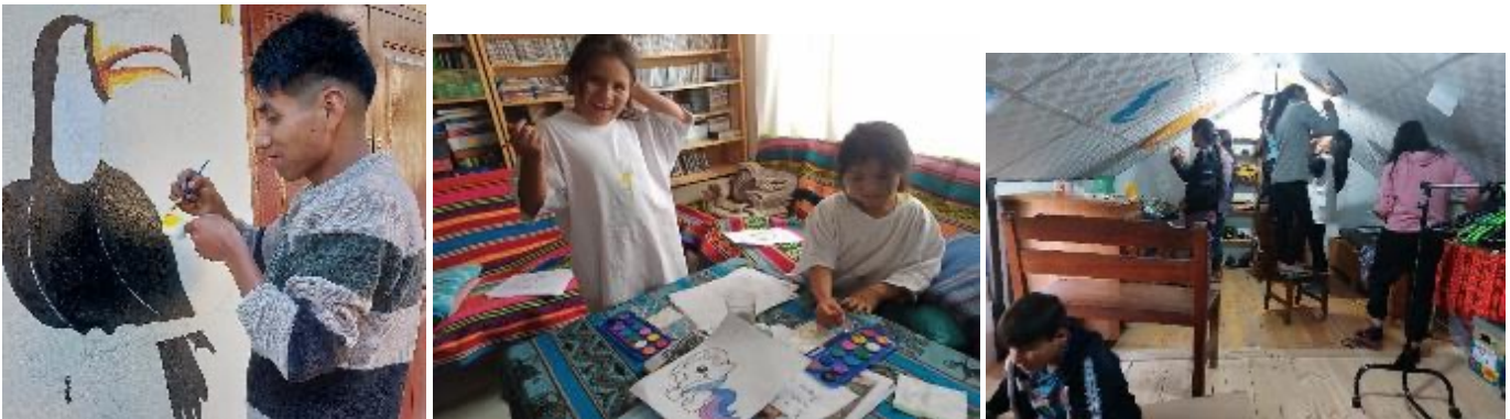
Die Kinder und Jugendlichen von heute haben den Bezug zu diesen Sagen verloren. Damit diese wieder wertgeschätzt werden können, braucht es geeignete Schulbücher mit LIEDERN, SAGEN, LEGENDEN und GEDICHTEN. Für die Erstellung und den Druck solcher Bücher beantragt das Kulturzentrum finanzielle Unterstützung durch das KINDERMISSIONSWERK Aachen, denn ohne externe Hilfe sind wir nicht in der Lage, solche Materialien herzustellen.