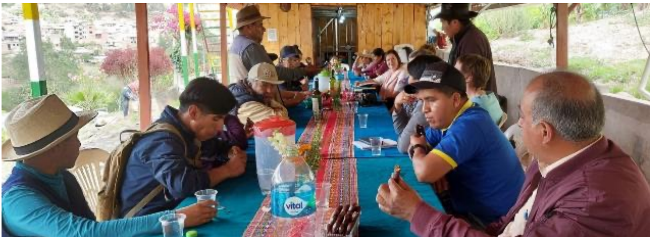
Empfang und Planung der bikulturellen Arbeit DEUTSCHLAND - INDEPENDENCIA auf der Grundlage einer guten Arbeit zwischen Bürgern, die sich gegenseitig verstehen und sich auf Programme und Projekte für unsere REGION einigen.