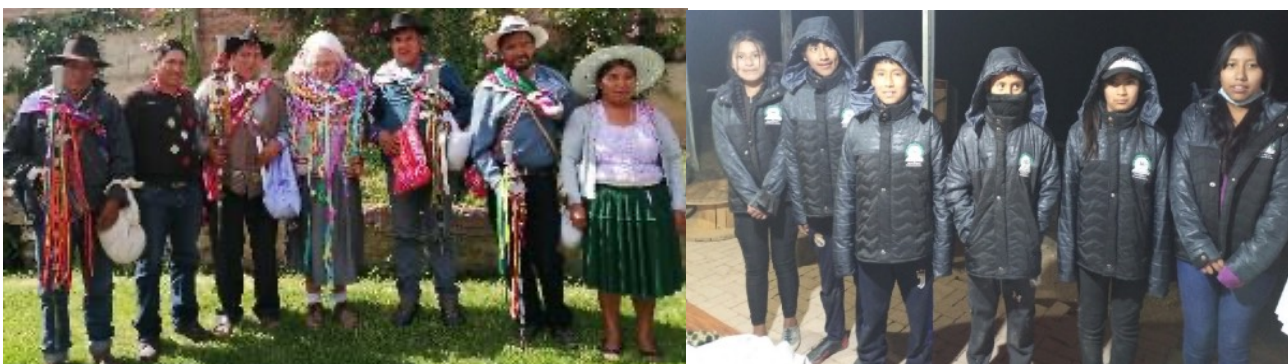
Die URSPRÜNGLICHEN BÜRGERMEISTER sind für uns das VORBILD dafür, anderen zu dienen, ohne viel von der Gemeinschaft zu erwarten. Unser Team von ELECTRICOS sin FRONTERAS INDEPENDENCIA ist der Stolz unserer Einrichtung. Nachdem sie die Prinzipien der PHOTOVOLTAIKEN ENERGIE erlernt haben, leisten sie jedes Wochenende ihren FREIWILLIGEN DIENST, indem sie die Familien auf dem Land mit SOLAREM LICHT versorgen.

2.- Die Bauern und alten Menschen, die ohne staatliche Hilfe in abgelegenen Andendörfern leben, bekommen endlich Licht durch saubere Energie dank der Installation von Photovoltaikanlagen. Hier zum Beispiel in der Gemeinde Independencia, Cochabamba- Bolivia.