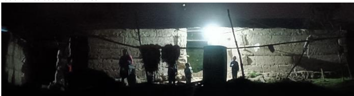
Dank der Solarpaneele können die Bauern nun auch bei Dunkelheit sehen.